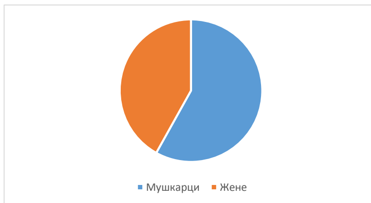
Графикон 2: Захтеви за реадмисију према полу повратника, 2017. година